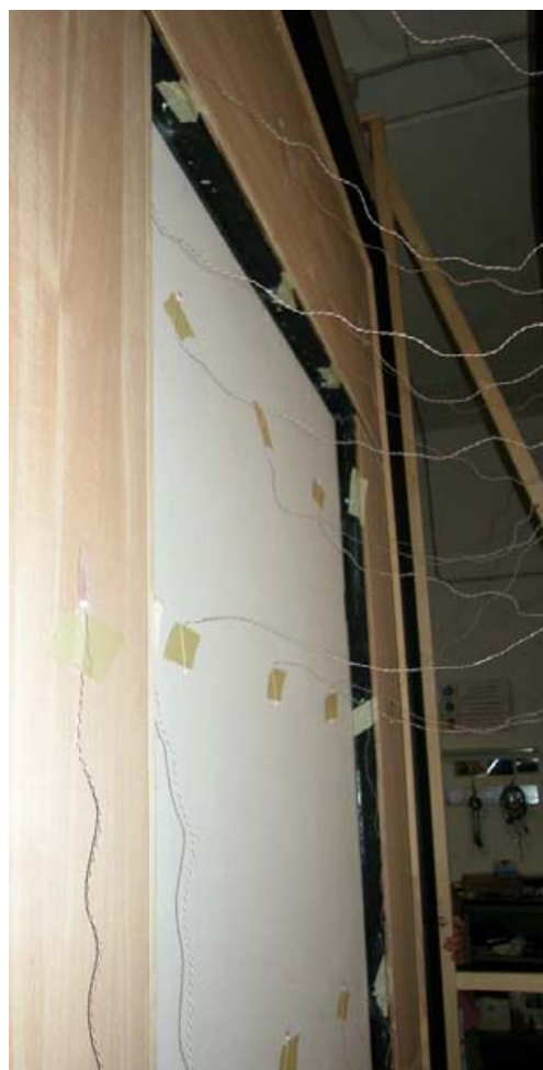
Figura 4 – Campione di prova installato nell'apparato di misura; lato caldo (pannello di legno) e lato freddo (pannello in ossido di magnesio)