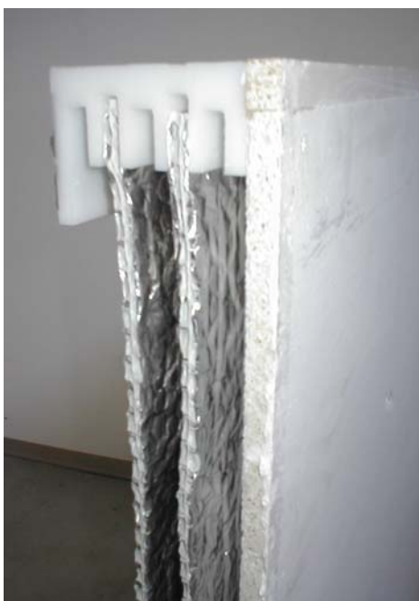
Figura 1 – Immagine del Cappotto S.A.M.E.

Il campione di prova è costituito da un pannello di ossido di magnesio di 12 mm, un'intercapedine d'aria di 20 mm e due strati di Isoliving intervallati da un'intercapedine di 20 mm (Figura 1). Nel calcolo è valutato anche l'effetto dell'ulteriore intercapedine d'aria (20 mm) a valle del secondo strato di Isoliving.