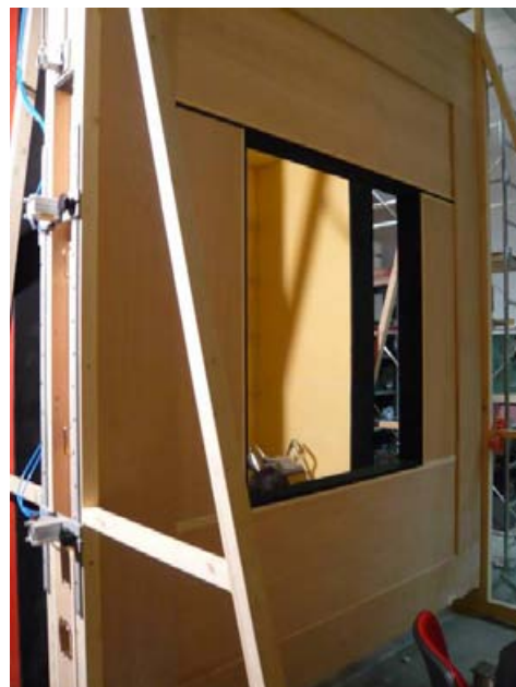
Figura 2 – Apparato di misura