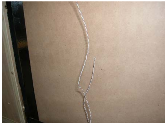
Figura 3 – Pannello in legno con sonde di temperatura installate internamente ad esso